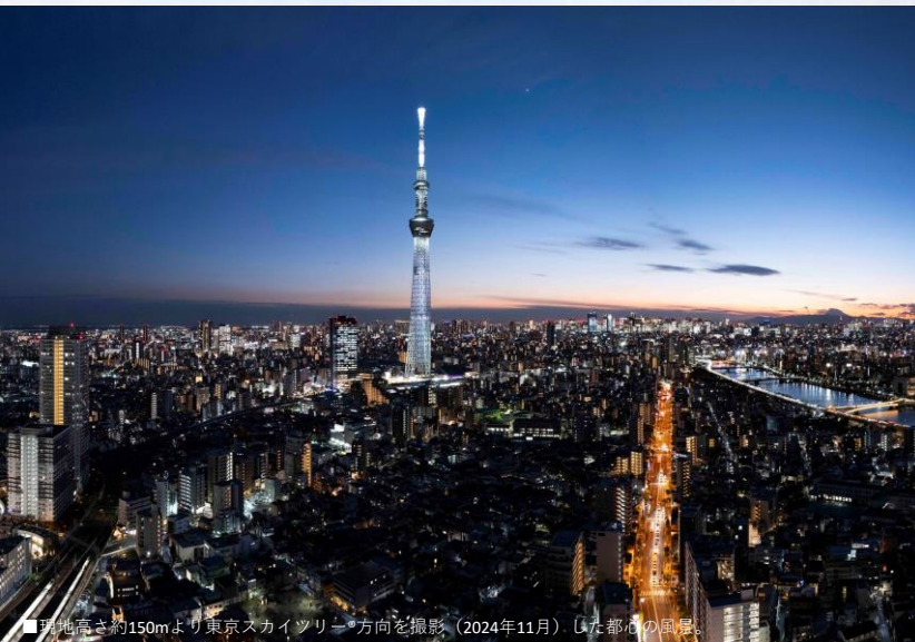
■現地高さ約150mより東京スカイツリー方向を撮影。(2024年11月) した都心の風景。