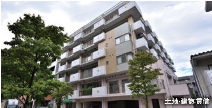
土地・建物・賃借

今までのライフスタイルを維持し、自由に自立した暮らができる住まい。 健康状態の変化に応じ、最適なタイミングで住みかえもできます。