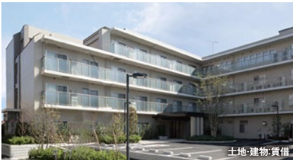
土地・建物・賃借