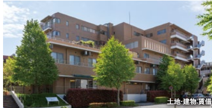
土地・建物・賃借