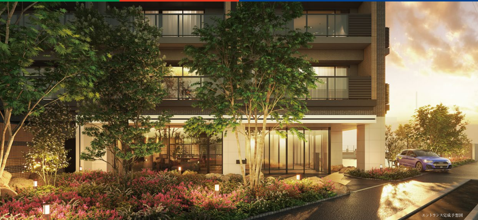
エントランス完成予想図

※掲載の完成予想CG・敷地配置図は、設計図面に基に作成したもので形状・色等は実際のものとは異なります。また、外観形状の細部、設備機器等は表現されておりません。