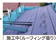
施工中(ルーフィング張り)