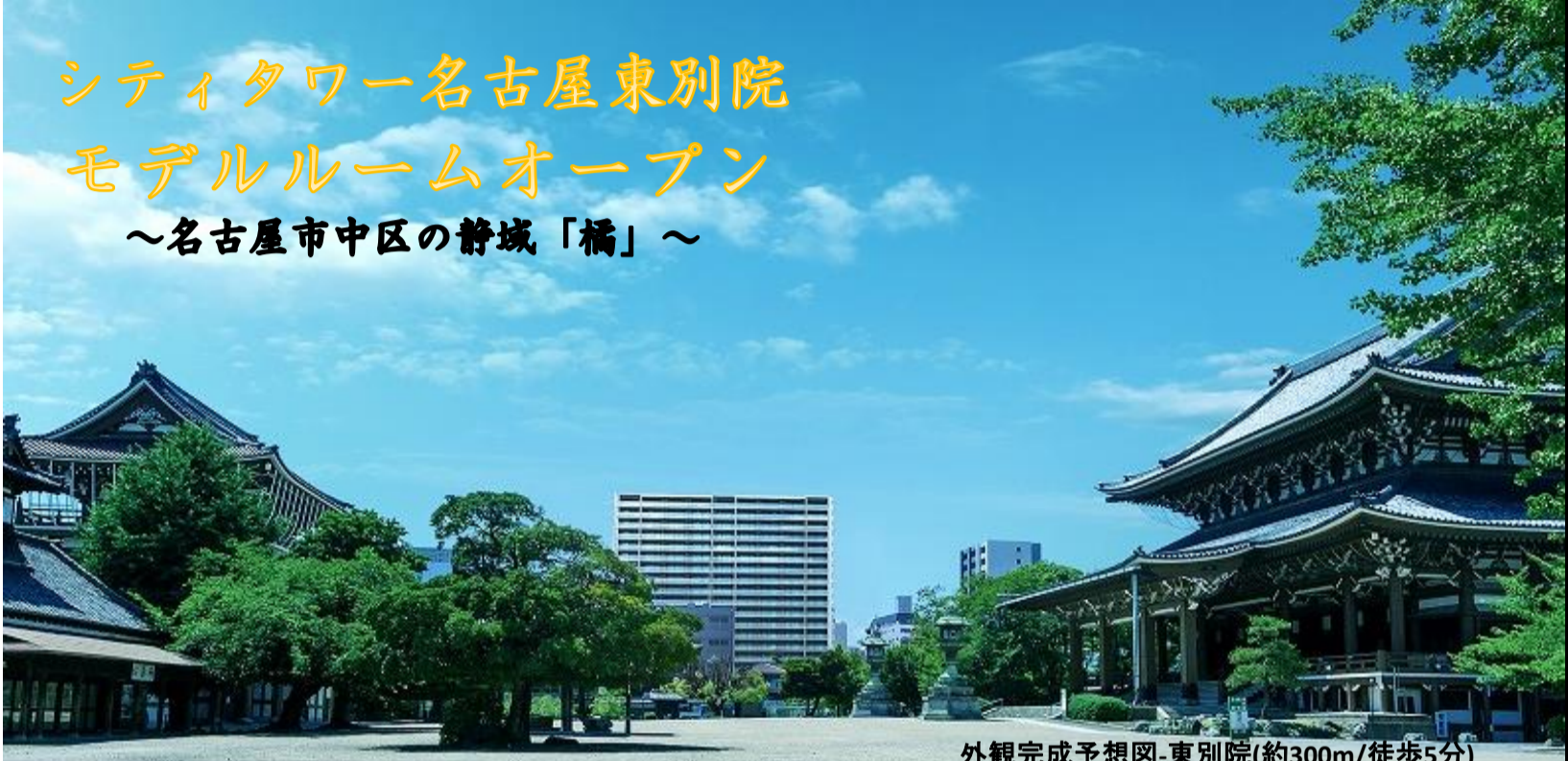
外観完成予想図-東別院(約300m/徒歩5分)

※掲載の外観完成予想図は、東別院境内から北西方向を撮影した写真(2023年6月撮影)に計画段階の図面を基に描き起こした建物完成予想図をCG合成・加工したもので、実際とは異なります。 また、周辺環境・眺望は将来変わる場合があります。また、形状の細部および設備機器等については省略しております。