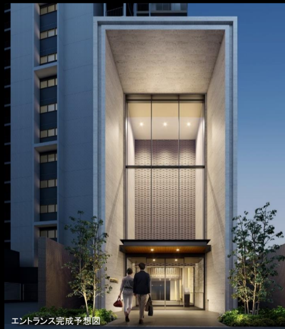
エントランス完成予想図