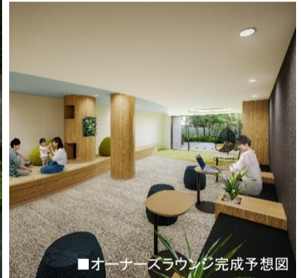
■オーナーズラウンジ完成予想図