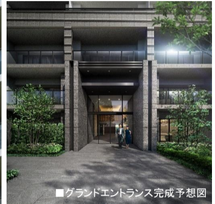
■グランドエントランス完成予想図